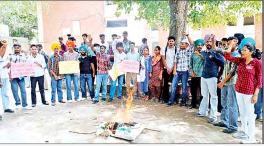
ਰਾਜਿੰਦਰਾ ਕਾਲਜ ਬਨਿੰਡਾ ਦੇ ਪਿੰਸੀਪਲ ਖਿਲਾਫ ਰੋਸ ਪ੍ਰਦਰਸ਼ਨ ਕਰਦੇ ਹੋਏ ਪੀ.ਐਸ.ਯੂ. ਆਗੂ।

ਵਿਚਾਰਧਾਰਾ ਵਾਲੀ ਕੱਚਰ ਦੀ ਮੱਦੀ ਸਰਕਾਰ ਦੀ ਤਰ੍ਹਾਂ ਪੰਜਾਬ ਵਿਚ ਆਮ ਆਦਮੀ ਪਾਰਟੀ ਦੀ ਸਰਕਾਰ ਵਲੋਂ ਵੀ ਸੰਘਰਸ਼ੀਲ