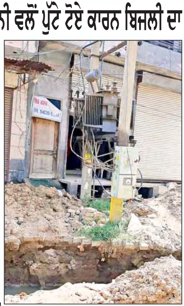
ਕੋਟਕਪੂਰਾ ਦੇ ਮੁਹੱਲਾ ਆਨੰਦ ਨਗਰ ਵਿਖੇ ਬਿਜਲੀ ਦੇ ਟਰਾਂਸਫਾਰਮਰ ਦੇ ਖੰਭਿਆਂ ਨਾਲ ਗੈਸ ਕੰਪਨੀ ਵਲੋਂ ਪੁੱਟੇ ਟੋਏ ਦੀ ਤਸਵੀਰ।