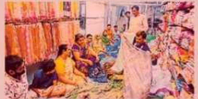
साहियों की दुकान पर कपड़े की खरीदारी करते हुए।

इलेक्ट्रोनिक्श संगर्भेट में कंपनियां नए फीचर्स के साथ. नए गॉडल लाई है। डिस्काउंट ऑफर्स के कररण कीमतें भी अमेशाकृत कम है। बार्शवारियों के अनुसार इलेक्ट्रॉनिक्स अञ्चटम जी सबसे ज्यादा डिमांड बढी है। व्यापारियों ने बताया कि धर के लिए एसईरी, वॉकिंग मतीन और फिज को राहक जराया पसंच: कर रहे हैं। इसके लिए बाहर से भी सामान का स्टीक करना शुरू कर दिया है।