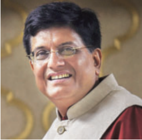
Union Minister Piyush Goyal reviewed the export scenario in his interaction with representatives of industry associations

goods, petroleum products, gems and jewellery, pharmaceuticals, readymade garments, cotton yarn and plastic.