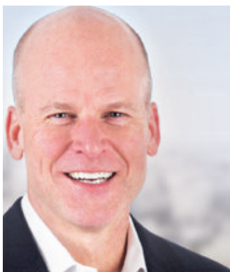
"WHILE MANUFACTURING HAS IMPROVED SINCE THE FIRST PHASE OF THE LOCKDOWN, THERE IS STILL SIGNIFICANT SUPPLY CHAIN DISRUPTION, INCLUDING ON STOCK GOING INTO RETAIL STORES. THE IMPACT WILL BE VISIBLE IN THE SECOND QUARTER"