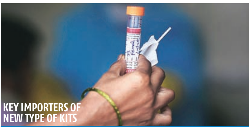
KEY IMPORTERS OF NEW TYPE OF KITS

There are two types of Covid-19 tests — antigen and antibody tests, and molecular tests. Molecular tests refer to reverse transcription polymerase chain reaction (RT-PCR), where a throat or nasal swab from