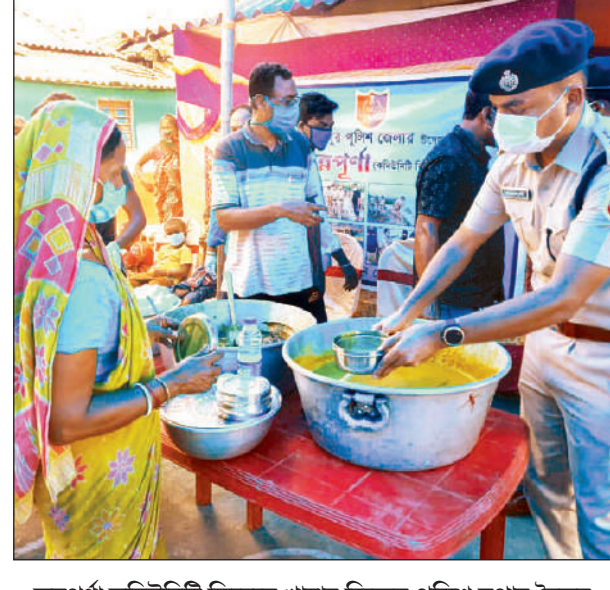
তিওয়ারি। বুধবার, গোসাবায়।

হলের ভর্তকি সমেত দাম লিটার প্রতি ২ টাকা ৬৫ য়েসা বাড়িয়েছেন। এর ফলে, স্থানীয় বিক্লেতার কাছে জুন মাসের প্রাপ্য নীল কেরোসিন তেল যা ১লা জুন ২০২১ বা তার পরে পৌছবে, তার দাম র্তমান খুচরো দামের থেকে লিটার প্রতি ২ টাকা ৬৫ পয়সা বেডে যাবে। বর্জিত দামের সাথে পণা ধ পরিষেধা কর যুক্ত হয়ে খুচরো দাম নির্বারিত হবে ঘাদেশানুসারে, অধিকর্তা, ভোগ্যপণ্য অধিকার।