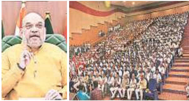
Union Minister for Home Affairs and Co-operation Amit Shah addresses the 70th Annual General Meeting of the Gujarat State Cooperative Agriculture and Rural Development Bank Ltd, through video conferencing, in New Delhi on Tuesday.

DBT was started in January 2013 to reform the government delivery system for simpler and faster flow of funds to the targeted beneficiaries.