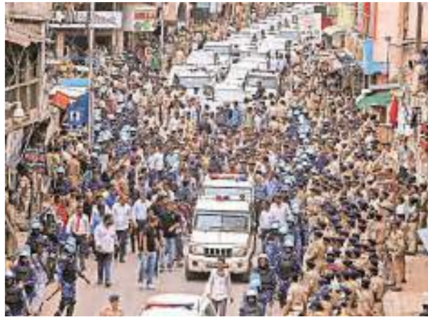
Minister Harsh Sanghavi leads a route march ahead of the Jagannath Rath Yatra; (below) Paramotoring trial at the GMDC ground for surveillance during the procession. Nimral Harindran

“On June 29 at 8 am, idols of Lord Jagannath, Subhadra and Baldev will enter the garbh guruh (sanctum sanctorum) and then after pooja ceremony, the idols will be blindfolded as per ritual. Then at 9:30 am on Wednesday, Gujarat BJP President CR Paatil will attend a flag hoisting ceremony at the temple premises and later, former deputy CM Nitin Patel will honour the saints,” said